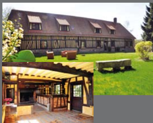
Cottage l'Orée Verte 2180 chemin de la Bretèque Tél : 02 35 71 95 33 / 06 20 59 26 67 loc.breteque@sfr.fr