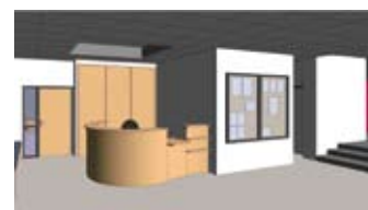
Vue du hall : banque d'accueil, zone d'attente et d'affichage

Ce grand chantier devrait s'achever en novembre/décembre 2011 et entraînera, malgré toutes les mesures prises par la Ville, quelques désagréments notamment au niveau du stationnement des véhicules, qui sera rendu plus difficile, d'autant que ces travaux coïncideront en partie avec un chantier de pose de réseaux, rue de la République.