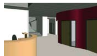
Vue du hall : circulations verticales et cabines pour la délivrance des passeports