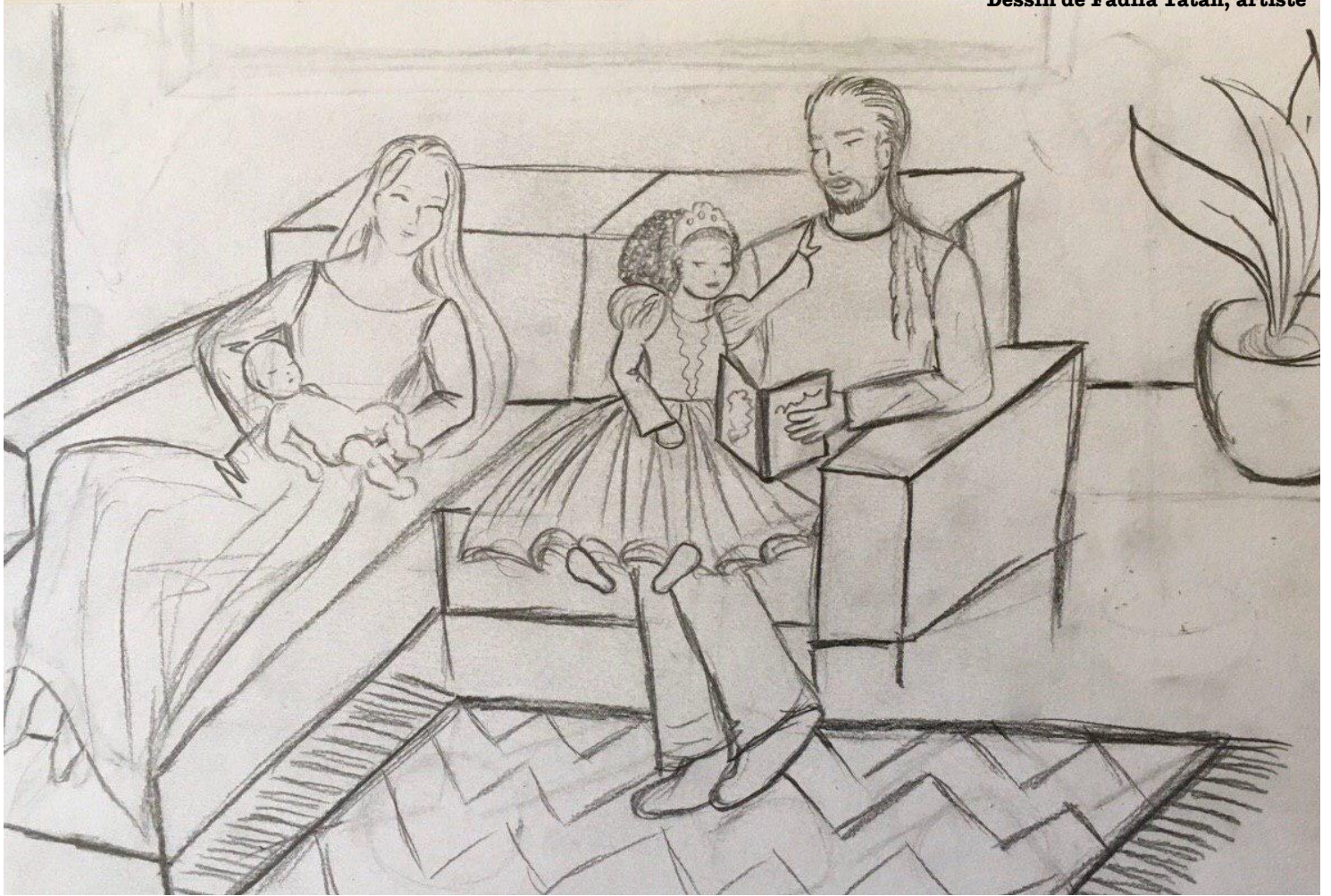
Dessin de Fadila Tatab, artiste